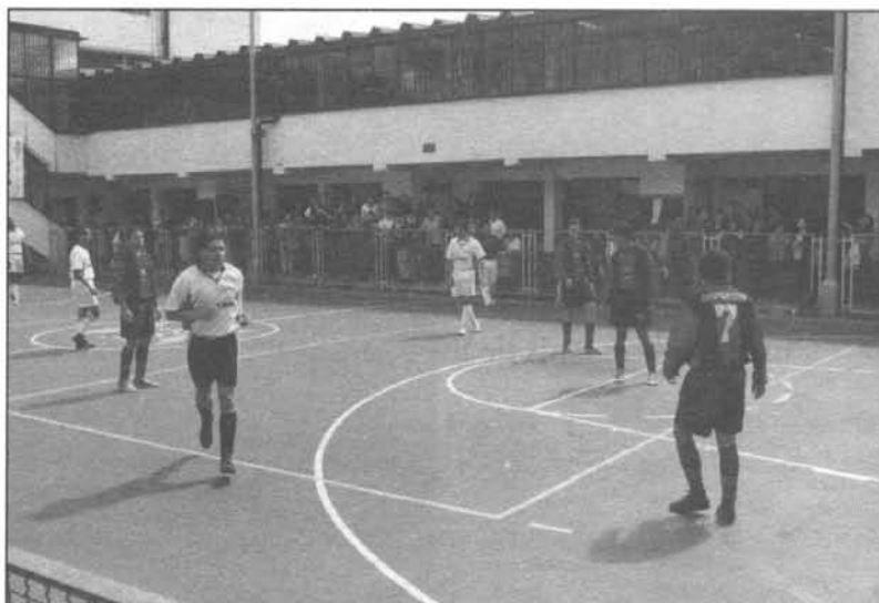
Partido de microfútbol entre los equipos del Departamento de Sistemas y Secretaría General, en las Olimpiadas Centralistas.

Dentro de la cuantiosa programación deportiva se organizaron las IV Olimpiadas Centralistas, que congregaron durante 40 días a más de 520 funcionarios y docentes compitiendo en disciplinas como baloncesto, voleibol