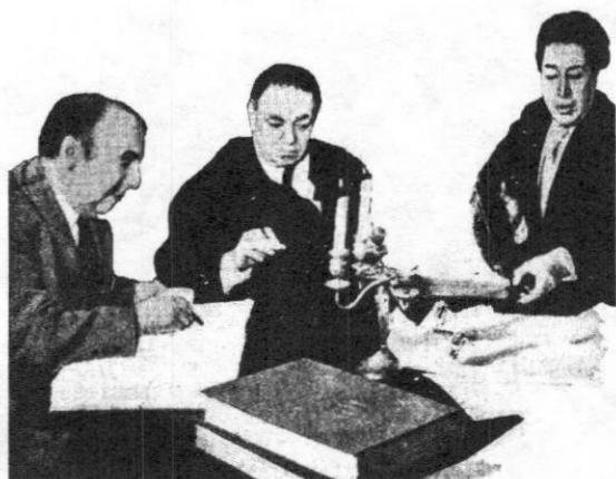
Primera edición del Canto General . Acta de la firma de los ejemplares. Con Pablo Neruda, Diego Rivera y David Alfaro Siqueiros. México, 1950.