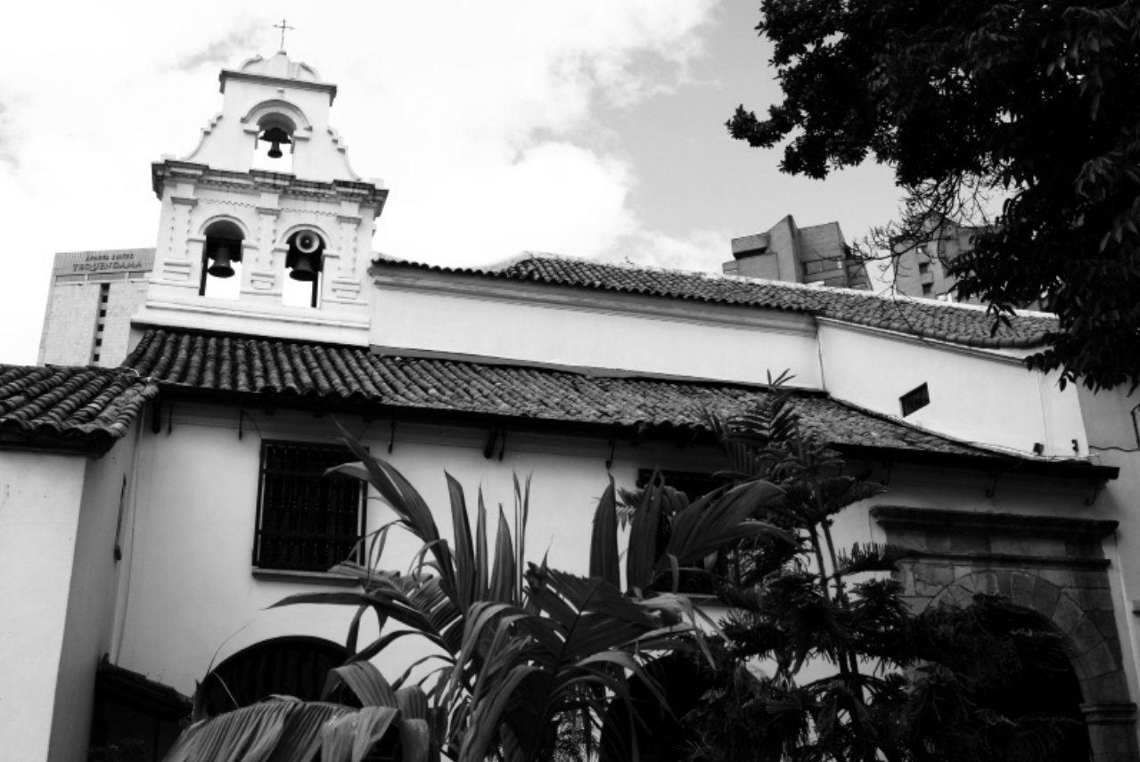
Iglesia de San Diego. La construcción de este templo católico data de principios del siglo XVII.

medio, al modo de una herida de muerte para una ciudad que recién empezaba a afrontar la modernidad en sus múltiples y variables formas.