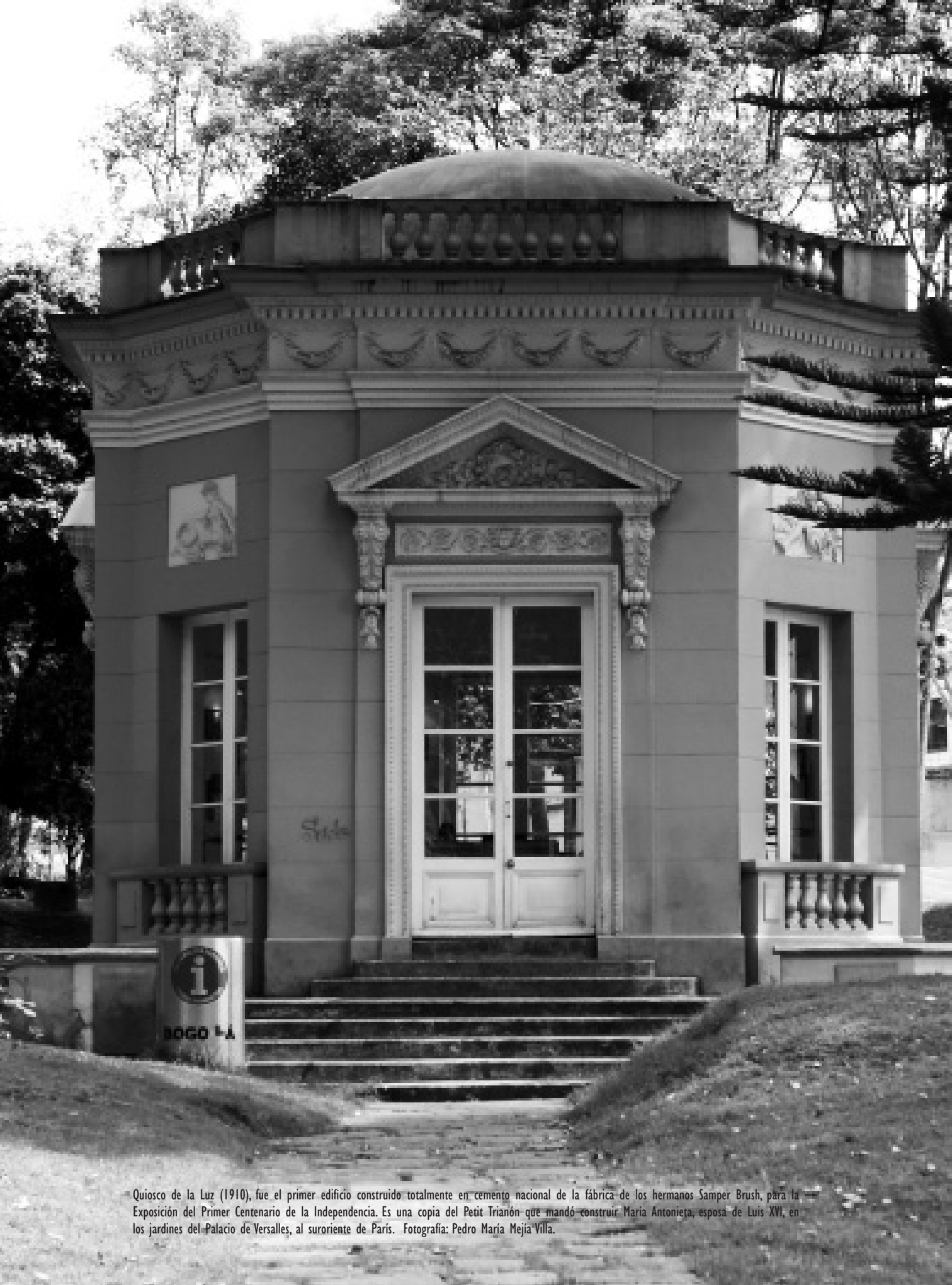
Quiosco de la Luz (1910), fue el primer edificio construido totalmente en cemento nacional de la fábrica de los hermanos Samper Brush, para la Exposición del Primer Centenario de la Independencia. Es una copia del Petit Trianón que mandó construir María Antonieta, esposa de Luis XVI, en los jardines del Palacio de Versalles, al suroriente de París.