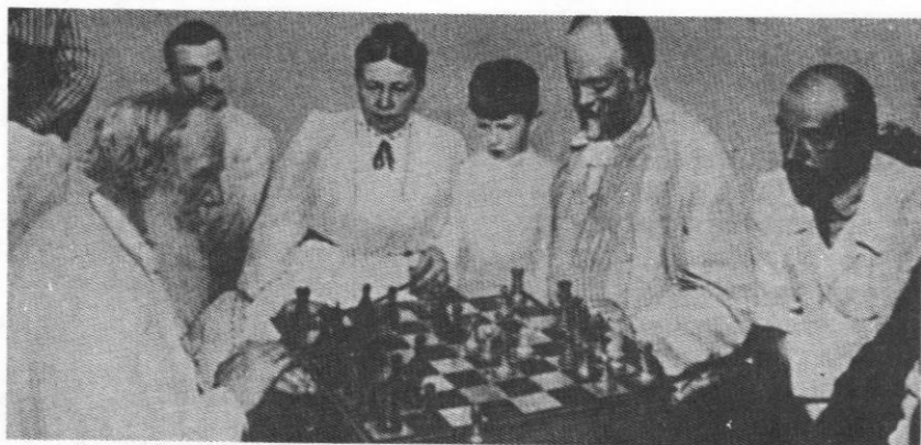
El gran escritor León Tolstoi jugando ajedrez en 1906 contra Aymer Maude en Polonia.