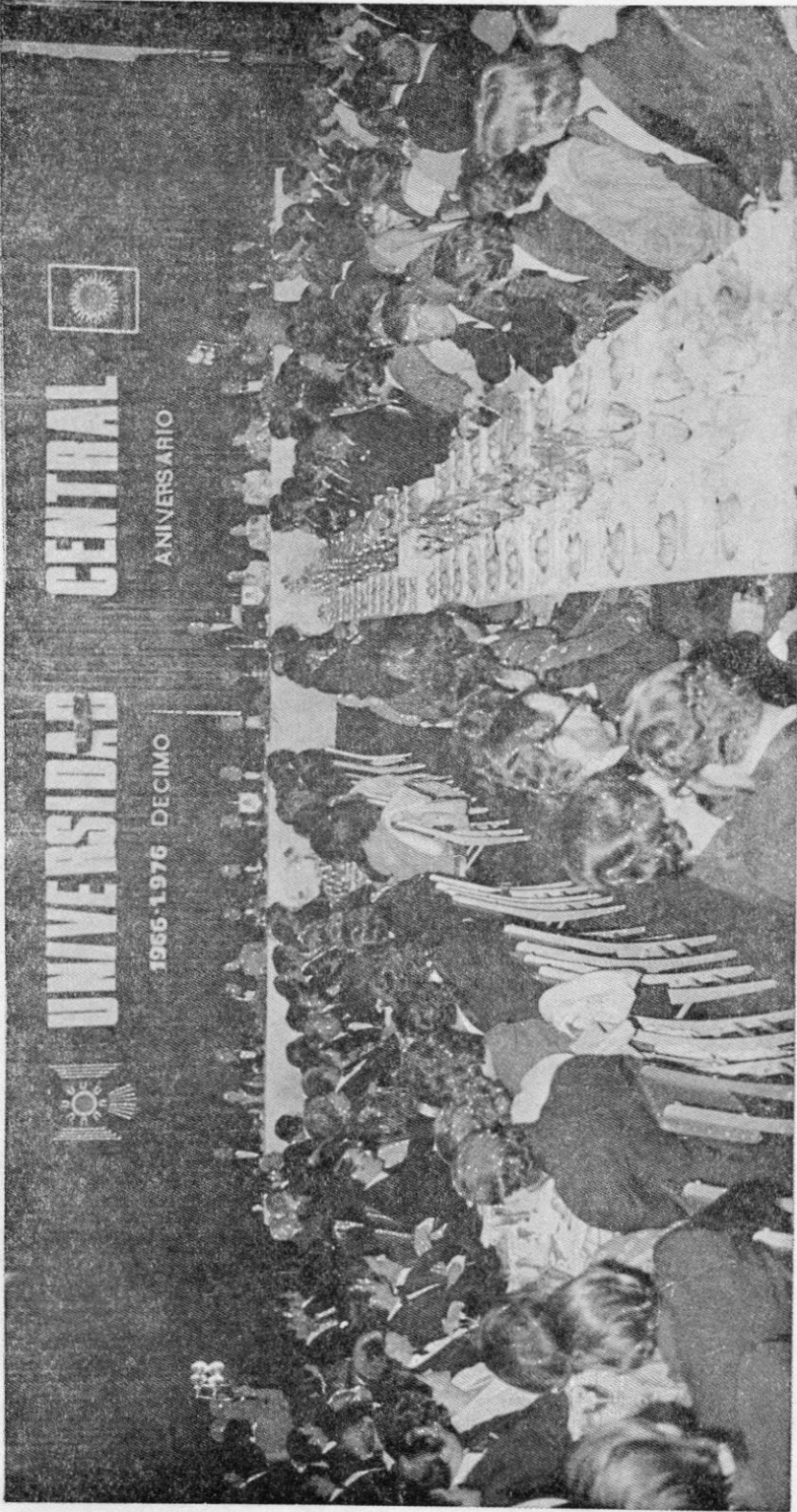
Aspecto que presentaba el Salón Rojo del Hotel Tequendama durante la cena ofrecida por la Universidad para celebrar sus primeros diez años de vida académica y administrativa.