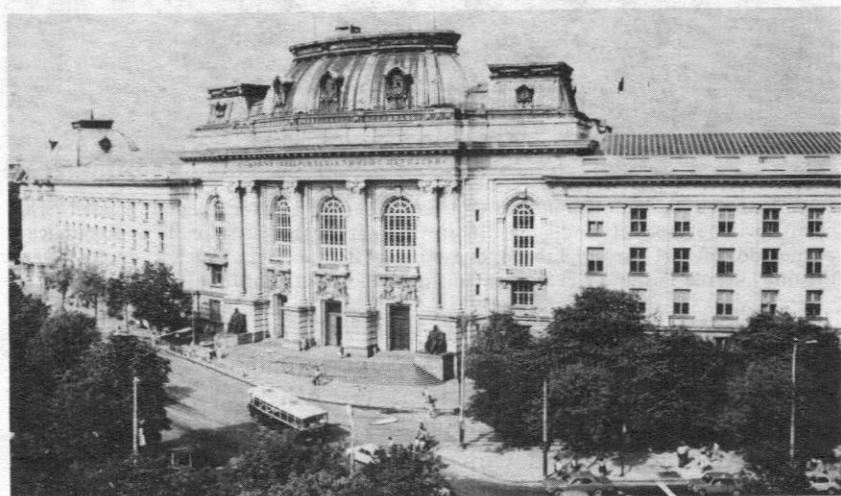
Universidad Kliment Ojridski

Bulgaria, cuna en el siglo IX de la escritura y la cultura eslavas, vió interrumpido su desarrollo cultural por la dominación otomana de cinco siglos. Destacadas personalidades del Renacimiento búlgaro (finales del siglo XVIII y principios del XIX) soñaban con que llegaría un día en que los búlgaros también tendrían "su propia escuela de ciencias superiores". Después de la liberación, la necesidad de funcionarios cualificados que atendieran la Administración del país y, sobre todo, el sector de la educación, planteó agudamente la necesidad de una universidad propia. La idea pasa por varias etapas hasta que, por fin, llega a la inauguración del Curso Pedagógico Superior en 1888.