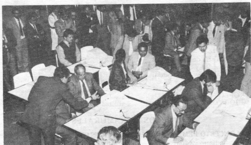
Durante la inauguración del Centro de Cómputo, se observa una vista parcial del mismo. Aparece un grupo del cuerpo directivo, decanos, presidentes de las asociaciones de exalumnos, profesores y estudiantes centralistas.

más moderna tecnología en el campo informático. Se escogió adelantarlos en cuatro etapas de un semestre académico cada una, para lograr atender en corto plazo las necesidades de esta importante disciplina de acuerdo con un esquema de prioridades asignadas y al mismo tiempo optimizar la utilización de recursos. Las instalaciones físicas básicas constan de cuatro salas de computadores con trece estaciones de trabajo cada una y una sala de control donde se encuentran los equipos administradores de la red y equipos especializados que requieren mayor atención por parte del personal administrativo del Centro. La selección del soporte físico (hardware) lo mismo que la del soporte lógico (software) se hizo cuidadosamente para lograr una serie de objetivos entre los cuales se deben destacar los siguientes: