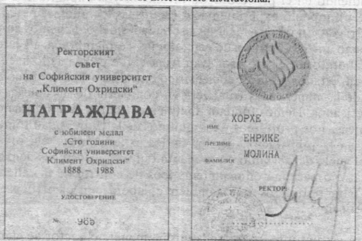
Diploma y certificación de la medalla entregada al rector centralista.