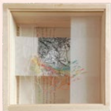
↓ Paisajes del pensamiento (detalle)