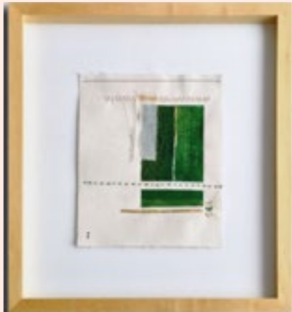
↓ Intenciones del silencio (detalle)