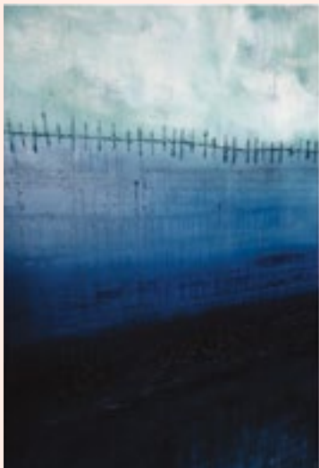
↓ Sagrada dualidad (detalle)