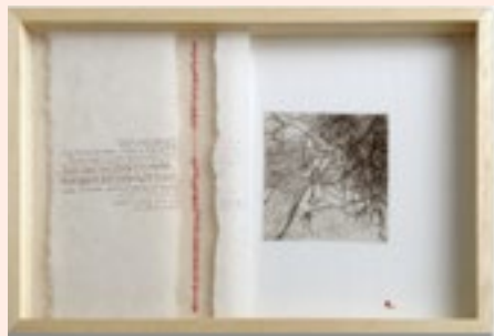
↓ Paisajes del pensamiento (detalle)