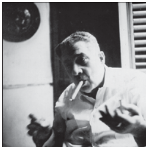
José Lezama Lima.

Aquel número incluyó colaboraciones de figuras tan altas de nuestra lengua como Gabriela Mistral, Alfonso Reyes, Vicente Aleixandre, Luis Cernuda, Jorge Guillén, María Zambrano, María Rosa Lida de Malkiel y otras