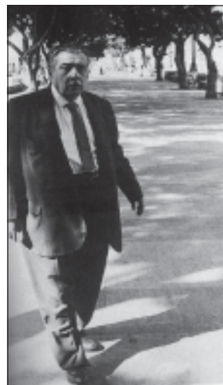
José Lezama Lima.