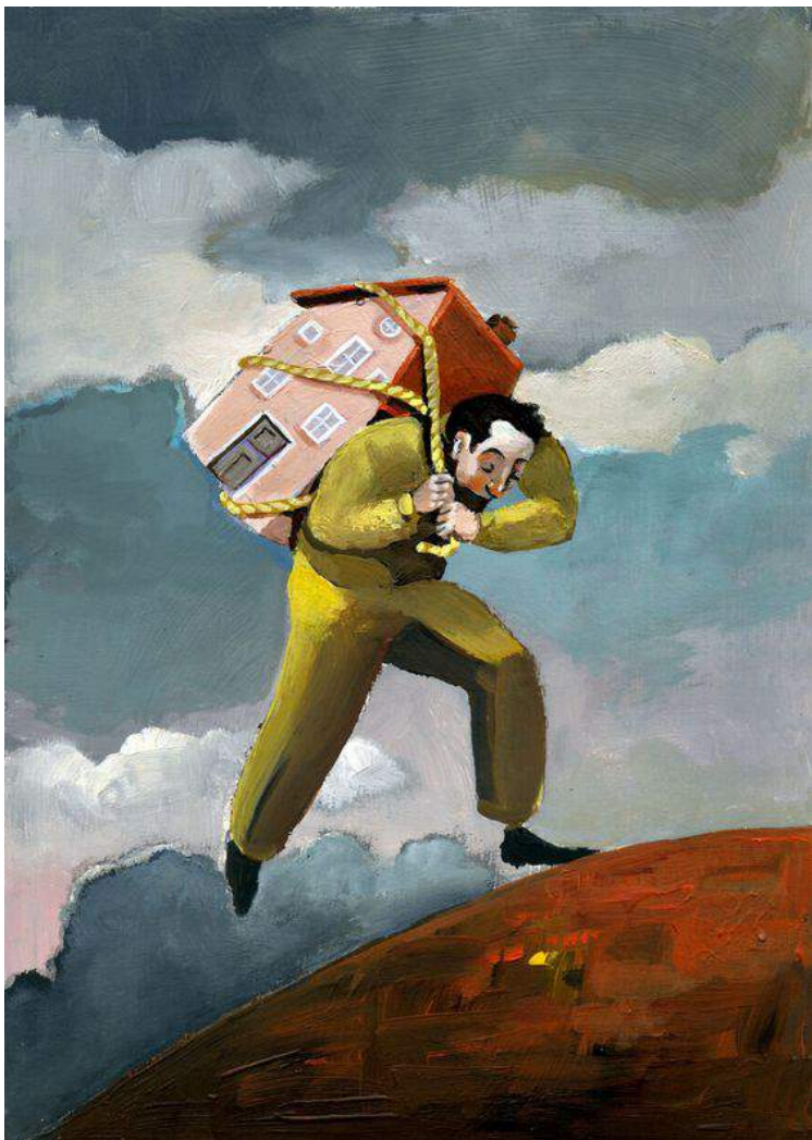
■ Recuerdos de inmigrante , acrílico en papel, Italia Autor: Cristina Bernazzani. Tomado de: Saatchi Art

Los desplazados internos permanecen dentro de su país de origen y tienen los mismos derechos y deberes que los demás ciudadanos. Por ejemplo, gozan del derecho a la salud, pero también son responsables ante la ley si cometen delitos. Más importante aún, los desplazados internos tienen derecho a disfrutar de las libertades civiles y recibir ayuda humanitaria, especialmente las mujeres, los niños y los ancianos. Las directrices recomiendan a los gobiernos que prohíban el desplazamiento “arbitrario”, como el causado por la guerra, el conflicto o el desplazamiento forzado, y el que afecta a los pueblos indígenas. Cabe señalar que los desplazamientos relacionados con el medio ambiente y el desarrollo no están prohibidos, aunque se insta a los gobiernos a proteger a los campesinos e indígenas en los casos en que los proyectos de desarrollo desalojen a las comunidades locales. Finalmente, los “grupos o personas de interés” incluyen a refugiados y desplazados internos que han regresado a sus países de origen de manera espontánea u “organizada”, a quienes se debe garantizar su seguridad y dignidad, con la ayuda del Acnur (Unhcr, 2018). Las personas a las que se les ha denegado el asilo y necesitan asistencia humanitaria también se incluyen en estos grupos.