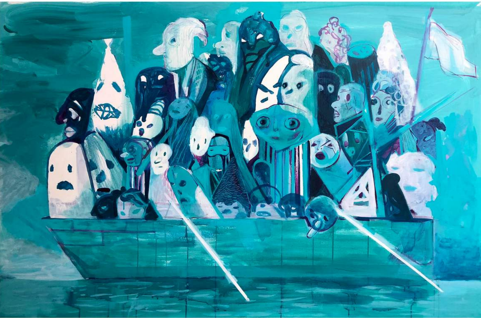
▪ Extraños , pintura, 2018 | Autor: Edelman Rodríguez.