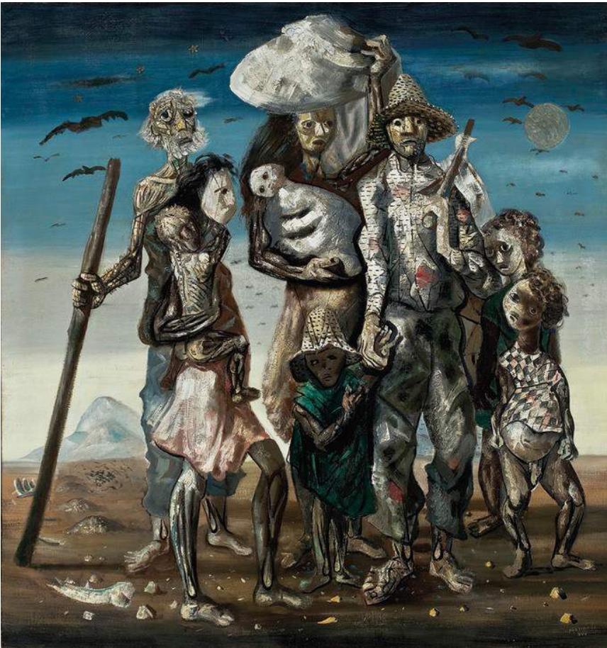
■ Os retirantes , óleo sobre tela, Sao Paulo (Brasil), 1994 Autor: João Musa.

El racismo institucionalizado hacia migrantes y solicitantes de asilo se está convirtiendo en una tendencia internacional, e influye en la ONU, como lo demuestra el proceso de adopción del Pacto mundial para una migración segura, ordenada y regular (2018), y el Pacto mundial sobre refugiados, iniciado en el 2001. Con motivo del quincuagésimo aniversario de la Convención sobre los Refugiados y debido al creciente número de refugiados y la multiplicación de sus causas, el Acnur convocó a Consultas Globales sobre Protección Internacional de los Refugiados (2001). Este proceso condujo a que el Acnur emitiera directrices que recomendaban a los gobiernos definir “refugiado” en un sentido más amplio y utilizar mecanismos de protección además de los de la Convención de 1951, también conocida como “protección complementaria”. La protección complementaria cubre a los “refugiados fuera de la Convención”, que reciben “protección fuera de la Convención”, lo cual incluye resoluciones de la Asamblea General de la ONU y