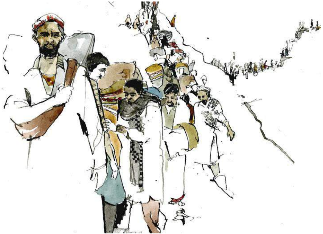
▪ Sin título, boceto, 2015 | Autor: George Butler. Tomado de: Maisielake Blog