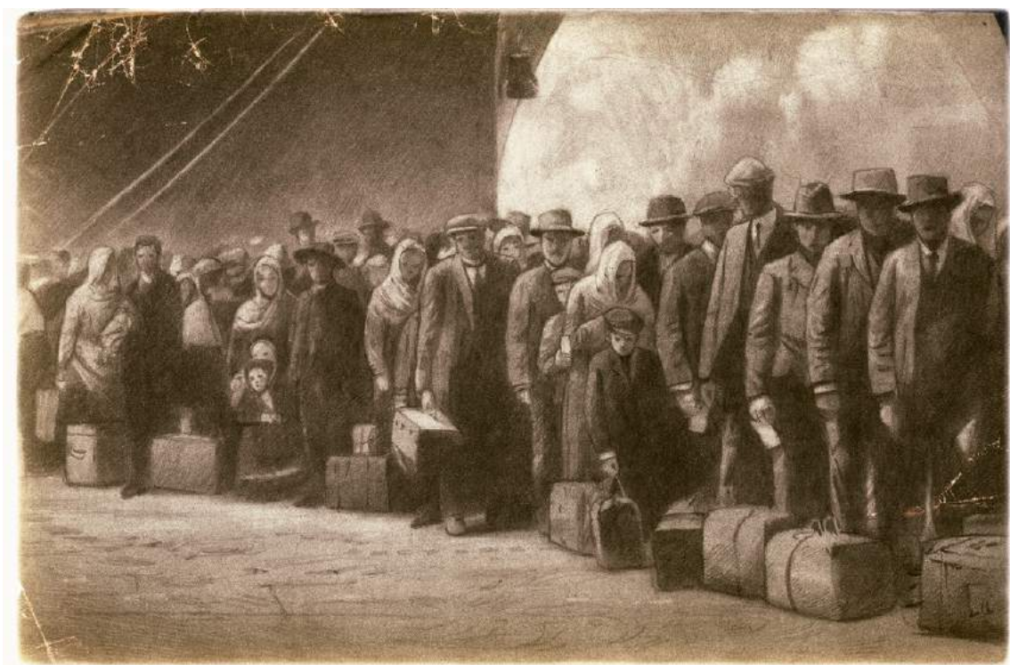
▪ Emigrantes, ilustración, 2006 | Autor: Shaun Tan.