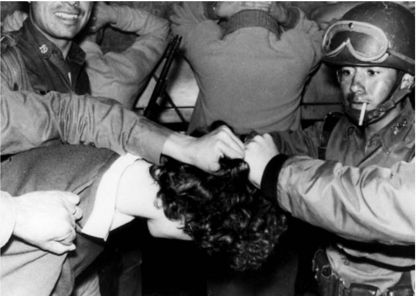
▪ Grupo de soldados detiene a un estudiante durante manifestaciones en Tlatelolco (México), el 2 de octubre de 1968

Los efectos performativos de la RC se desplazan de la vigilancia y el control empresarial a la vigilancia y el control de los sujetos. Para lograrlo trabajan en la materia blanda del cerebro, activando emociones extremas como el miedo al fracaso que activa la productividad, así como el narcisismo del éxito que la gratifica (sentimientos y emociones sobre los que se mueve en el plano subjetivo la RC), y que se expresan en la obsesión por la construcción de la imagen pública (la construcción de la marca personal) para