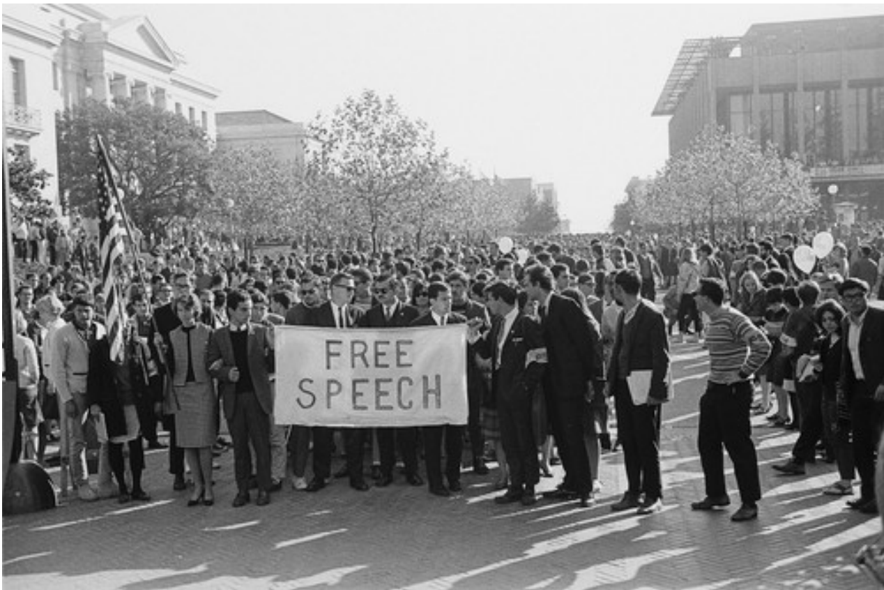
▪ Protestas de estudiantiles en Berkeley, California (Estados Unidos), noviembre de 1964

Diversos estudios críticos sobre los rankings universitarios (García y Pita, 2018; Barsky, 2014; Usher y Savino, 2006; Albornoz y Osorio, 2018) coinciden en señalar las debilidades en las metodologías y la falta de transparencia en los datos, los sesgos de medición por alta reputación histórica, tradición académica, lengua y territorio de origen de la firma evaluadora, así como la sobredeterminación de la productividad en investigación y publicaciones en revistas indexadas, en las que no tienen cabida las ciencias sociales y las humanidades o, cuando se las considera, se las mide con los mismos estándares de la producción tecnocientífica.