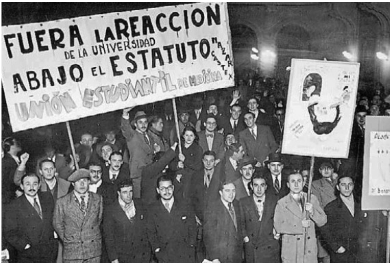
▪ Marcha de estudiantes de Medicina en Buenos Aires (Argentina), 1935

relaciones sociales en el seno del cual introduce un cierto número de efectos específicos. (Foucault, 2010, p. 106)