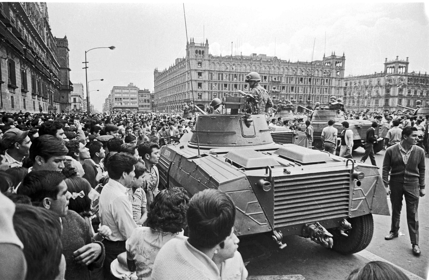
▪ Ejército en el Zócalo de México, en el marco de las manifestaciones en Tlatelolco (México), 1968