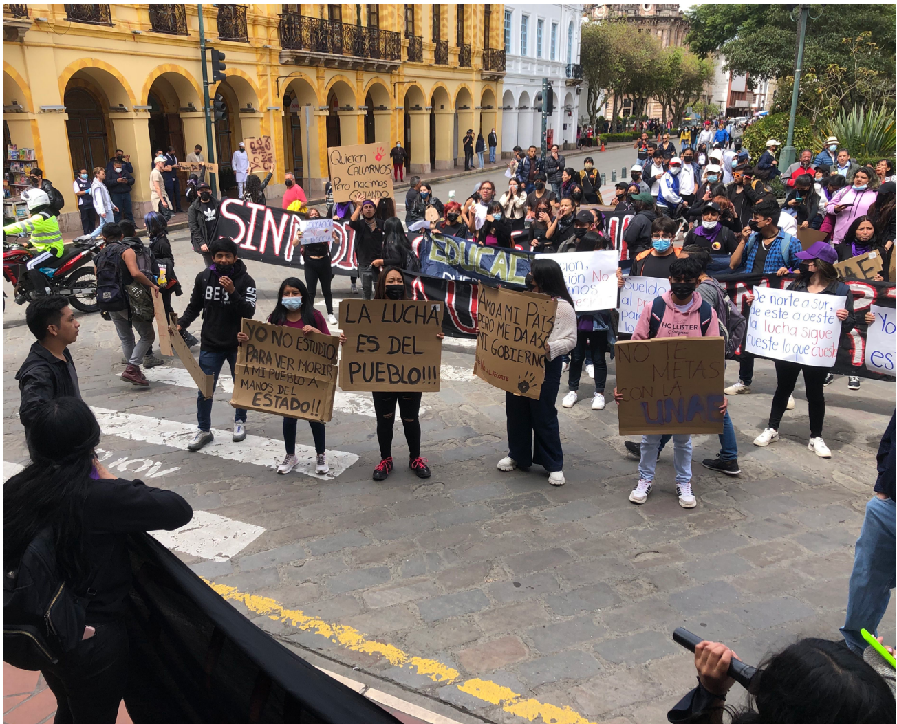
▪ Estudiantes universitarios protestan en la ciudad de Cuenca, en contra del Gobierno nacional. (Ecuador), 2022

Estos ejes misionales, a los cuales se añaden hoy la gestión, la gobernabilidad, la internacionalización y el uso de las nuevas tecnologías de la información y la comunicación, deben mirarse como retos que se presentan de forma articulada y complementaria. En este sentido, ha sido siempre tarea fundamental de la universidad producir conocimiento, comunicarlo críticamente y propiciar su aplicación a la solución de necesidades y problemas apremiantes de la sociedad. Las universidades deberán seguir siendo fieles a su