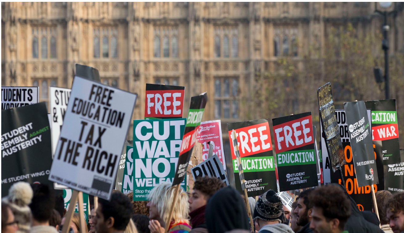
■ Protestantes cruzan por el Palacio de Westminster durante protesta en favor de la educación gratuita. Londres (Inglaterra), 2014

Herrera, 2021). En este proceso es central el papel que desempeñan las nuevas tecnologías de la información y la comunicación (TIC), articulado con los retos de la ciencia, la tecnología y la innovación como: incentivar la productividad intelectual, el relacionamiento universidad-empresa-Estado, la internacionalización de la investigación y el financiamiento. Esto acorta la vista a la hora de comprender problemas apremiantes de la región, considerando la vida precipitada de la academia universitaria, además de una pérdida de sensibilidad que se traduce en ceguera moral (Bauman y Donskis, 2015).