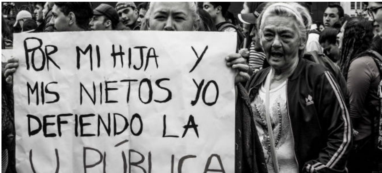
▪ Los colombianos protestan por la no voluntad del Gobierno Nacional para garantizar la educación pública y de calidad, 2018

humanista para la ciudadanía recoge una amplia tradición educativa occidental que desde Sócrates y Aristóteles se ha preguntado por las relaciones entre educación y ciudadanía. De cara al predominio adquirido por la formación en competencias productivas que proporcionan formas de saber hacer en contextos laborales específicos, Nussbaum (2011) propone una educación orientada a la formación para el desarrollo humano basada en tres capacidades fundamentales, como se presenta a continuación.