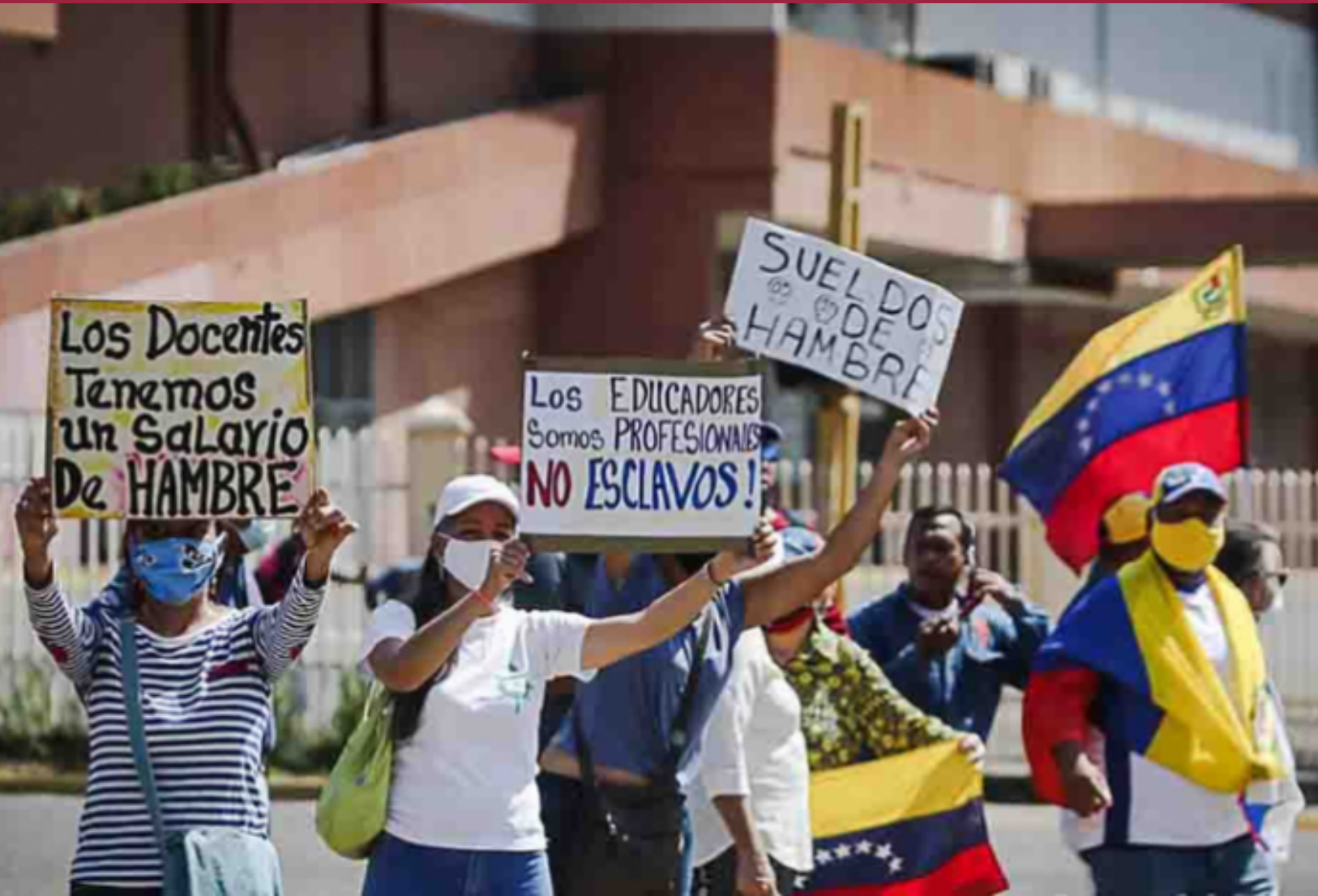
▪ Docentes en Caracas protestan por el incumplimiento en el pago de vacaciones por parte del Ministerio de Educación Nacional. Caracas (Venezuela), 2021