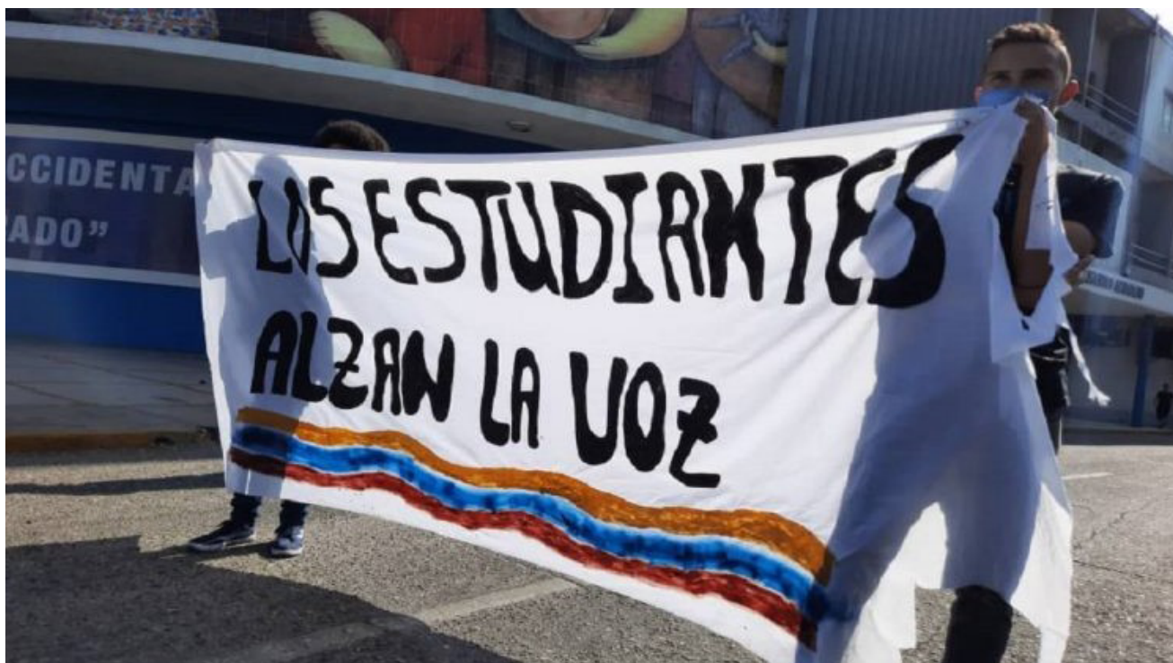
▪ Pancarta de estudiantes durante protesta universitaria. Caracas (Venezuela), 2021