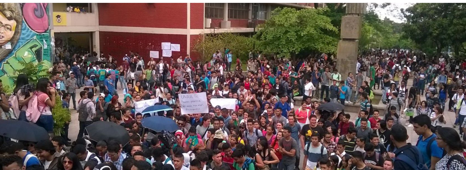
■ Movilización estudiantil por la educación al interior de la Universidad Nacional Autónoma de Honduras (UNAH). Tegucigalpa, 2016

Estos procesos han estado acompañados por el surgimiento de movimientos “Antibolonia” que cuestionan su carácter antidemocrático, el cual ocasiona, en su opinión, la pérdida de autonomía de la universidad y su sometimiento a la dinámica económico-productiva de un mercado educativo globalizado. Dichos movimientos se