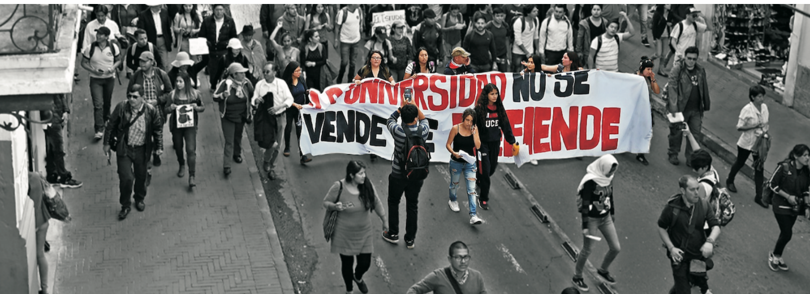
■ Protesta de estudiantes de la Universidad Central (Ecuador), en reclamo al recorte presupuestal, 2018

De las tres crisis mencionadas, la de hegemonía es quizás la más fundamental. En consecuencia, la universidad, especialmente cuando es pública, experimenta la pérdida de autonomía y la conversión gradual en un bien de mercado que debe responder al lucro y la utilidad económica para poder subsistir, dividiendo los presupuestos en recursos que aporta la nación y recursos propios que se obtienen por venta de servicios o convenios empresariales. La apertura de la universidad al mercado educativo nacional e internacional es el