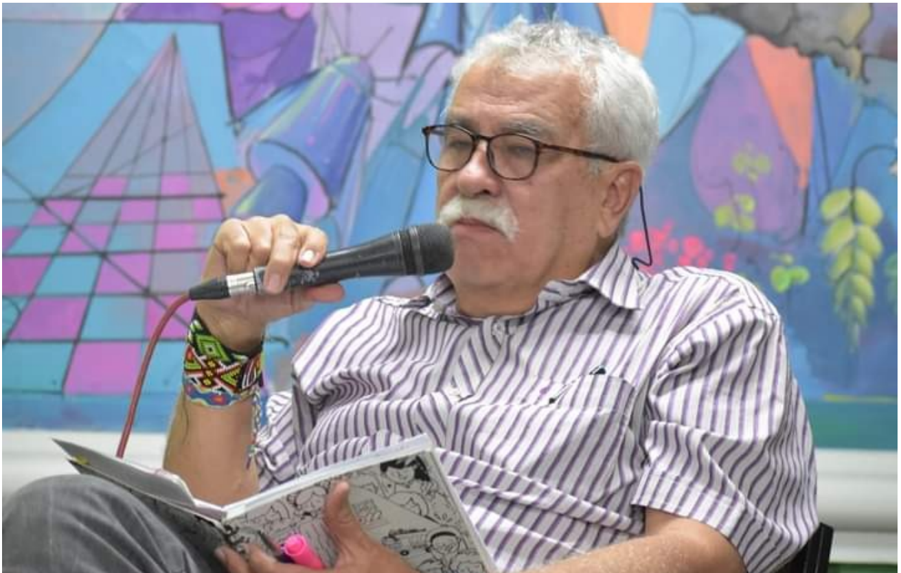
▪ En el "Seminario Saberes para la Paz", Medellín (Colombia), 2022

vida bonita y bien acomodada y sobre todo que su vida está hecha de texturas de mestizajes, tanto en su espiritualidad como en las opciones epistémicas que orientan sus producciones teóricas y en sus construcciones filiales. Su risa es tan contagiosa como sus declaraciones vehementes acerca del impacto de las políticas educativas en la escuela, en el (la) maestro(a) y en la pedagogía.