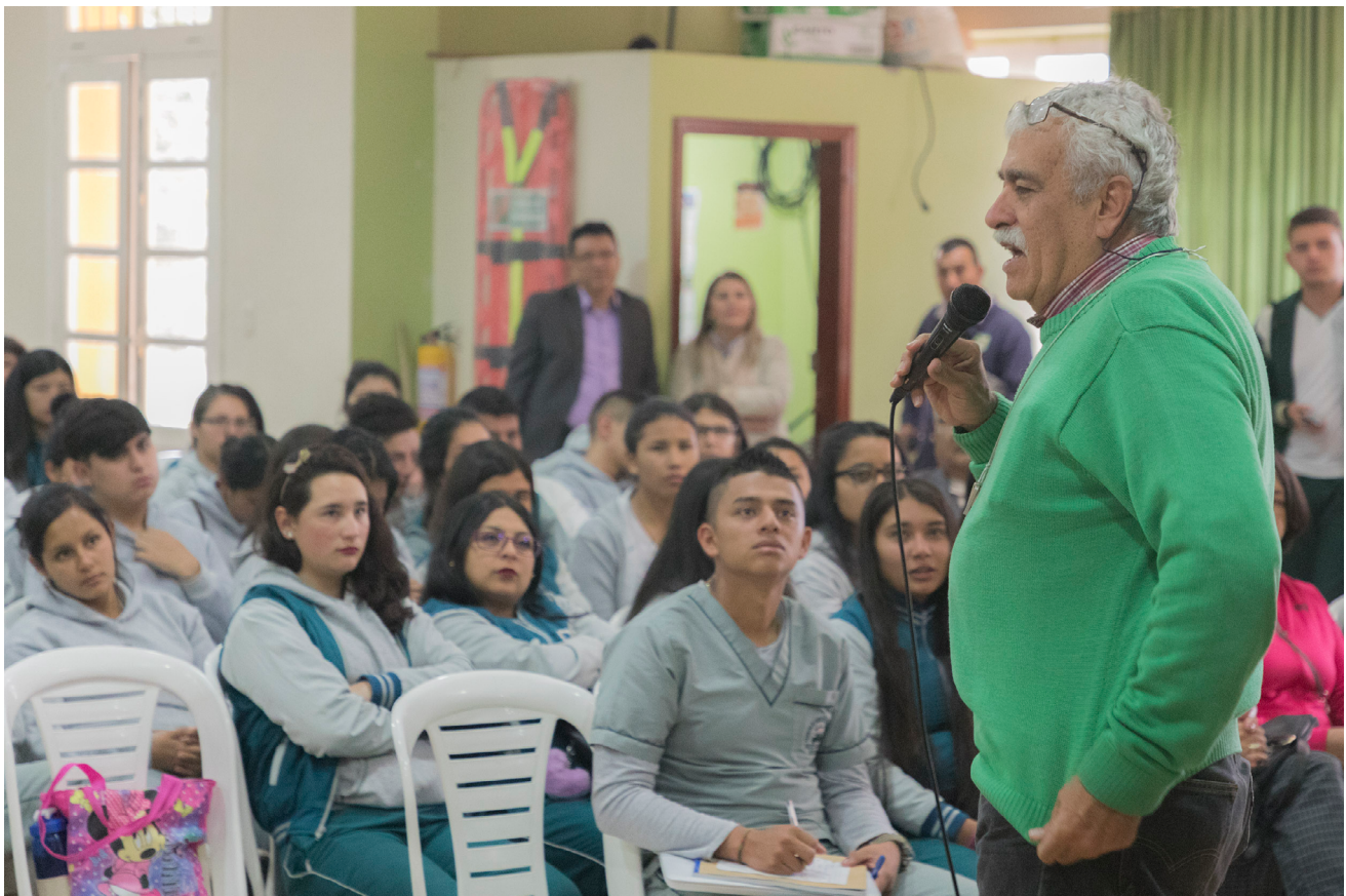
▪ Conferencia en el marco del Proyecto Innovador Educativo Municipal para los Saberes y la Alternatividad (PIEMSA). Pasto (Colombia), 2018

Uno de los énfasis en Marco ha estado situado en la producción social de saberes, prácticas y proyectos, de ahí su insistencia y persistencia en estar en el Consejo de Educación Popular de América Latina y el Caribe