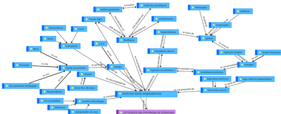
Figura 1. Red semántica de los aspectos socio-demográficos en los estudiantes del programa de Economía.

Fuente: Elaboración propia. Red semántica elaborada en Atlas TI.