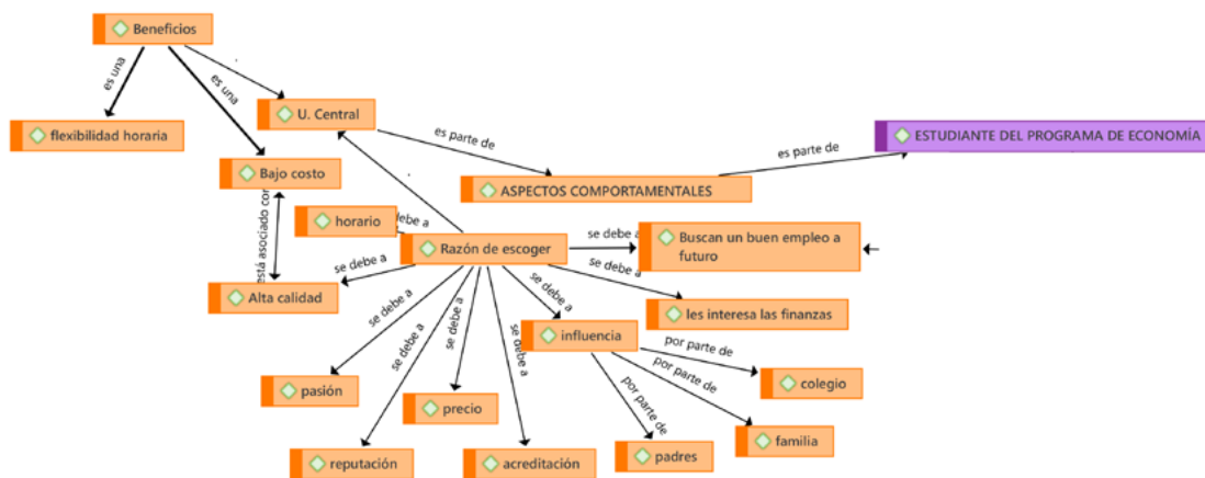
Figura 3. Red semántica de los aspectos comportamentales en los estudiantes del programa de Economía.